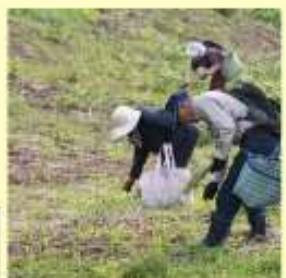
寺台農園わらび園